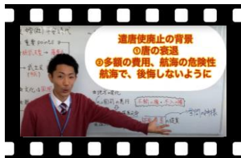
自宅でも先生の授業を受けたい人へ オリジナル動画 (無料)