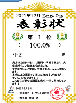
ほめて伸ばして 欲しい人へ 表彰制度