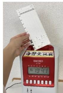
楽しく自習室を使いたい人へ タイムカードで時間を見える化！ (表彰制度もあり) 自習室チャレンジ