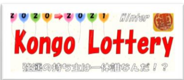
賞品につられたい人へ 頑張りに応じてもらえる宝くじ