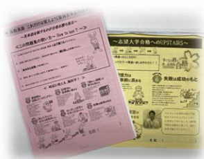
暗記が苦手な人へ オリジナル単語集

どうしたら「楽しく」「分かりやすく」勉強できるだろう？と考えていろいろな独自の取り組みを行っています。あなたに合うものがきっとあるはず！