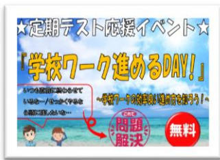
一人で勉強するのがイヤな人へ テスト対策イベント