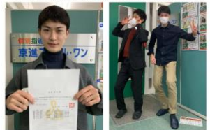
やるときは本気でやり、楽しむときはしっかり楽しむ！

○後輩にメッセージ 鉄は熱いうちに打て！興味があるうちに動け！口に出して行動に移せ！そして熱あるうちに、次の目標を立てることです！