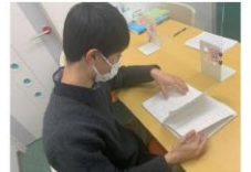
英語は自分でまとめたノートを作成。これを見ればOK!という一冊があるとう。

○入塾時、勉強時間はゼロ！ それが2時間、4時間...とどんどん増えていきました。