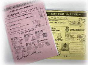
暗記が苦手な人へ オリジナル単語集