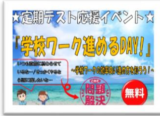
一人で勉強するのがイヤな人へ テスト対策イベント