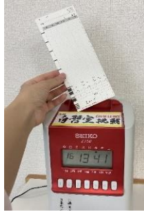
楽しく自習室を使いたい人へ タイムカードで時間を見える化！ (表彰制度もあり) 自習室チャレンジ