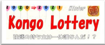
賞品につられたい人へ 頑張りに応じてもらえる宝くじ