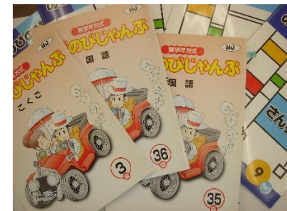
段階に分かれた教材を使用します